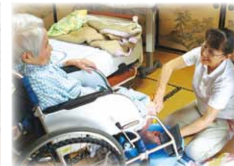
看護師による訪問看護