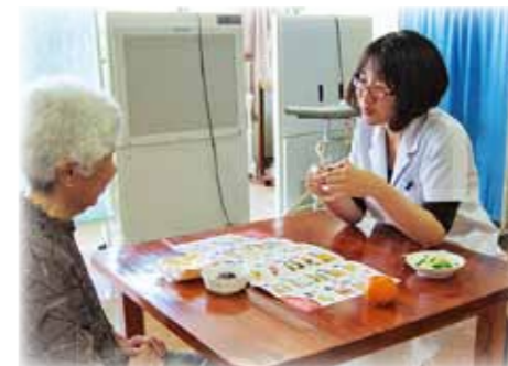
管理栄養士による栄養指導