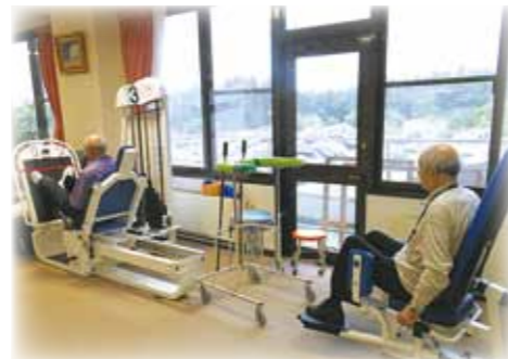
機器を使っでのリハビリの様子