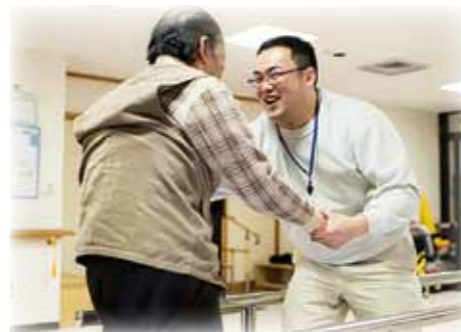
リハビリ専門スタッフによる機能訓練

学習療法とは、音読と計算を中心とする教材を用いた学習を、学習者と支援者がコミュニケーションをとりながら行うことにより、学習者の認知機能やコミュニケーション機能、身辺自立機能などの前頭機能の維持・改善を図るものです。