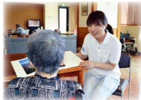
介護職員との触れ合い

介護を必要としないからだ作りを目的に、ご利用者様へ医師の指示を受けた理学・作業・言語聴覚士に加え、管理栄養士、歯科衛生士などの専門スタッフが健康管理や運動指導などのサービスを提供いたします。