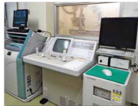
一般撮影検査 (CR・DRシステム)